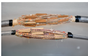
Detaljbild av Harry Hammars konstverk i koppartråd, blykabel och pappersisolering.