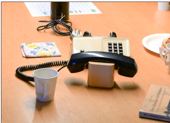
När man lägger luren på kuben spelar den pausmusik för den uppringande.