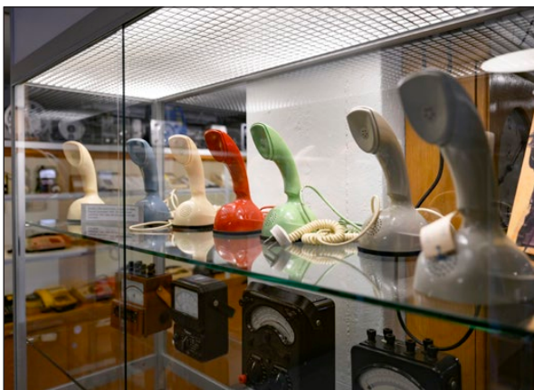
Kobratelefoner på rad.