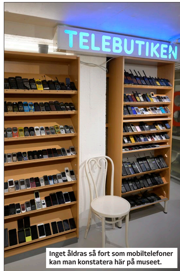
Inget åldras så fort som mobiltelefoner kan man konstatera här på museet.